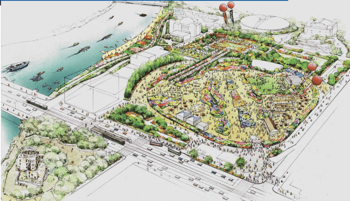
【全体平面図 プラン賞出展予定区画】

開催期間 2020年3月19日(木)～5月24日(日) 5月25日～11月23日は他会場の案内や観光・市町情報を提供、連携イベントを開催